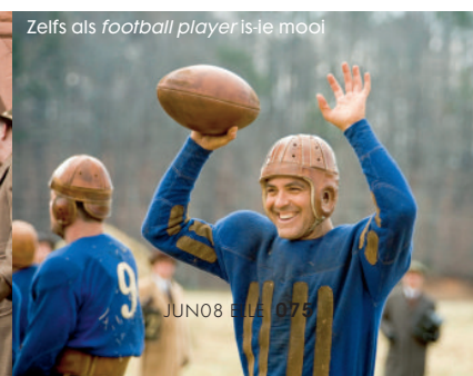
Zells als football player is-ie mooi