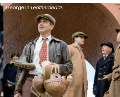
George in Leatherheads